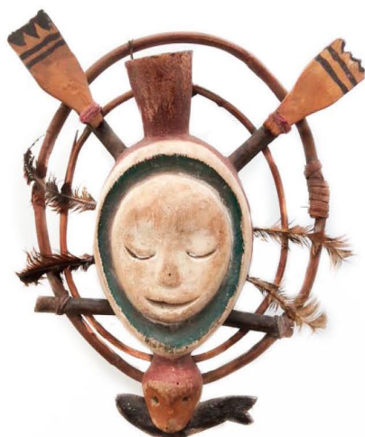
Masque esquimau

L'atelier masque est conçu pour tous types d'âges et de publics, dans un cadre scolaire ou Nombre de participants par atelier : 10 maximum