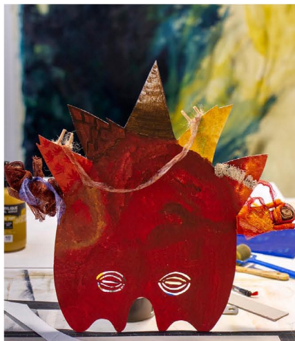
En atelier