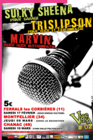
Vice Versa 2007

A l'adresse suivante : Vice Versa - ADDMD 11 - 30 avenue Franklin Roosevelt - 11000 Carcassonne - agnes.delbosc@addmd11.fr