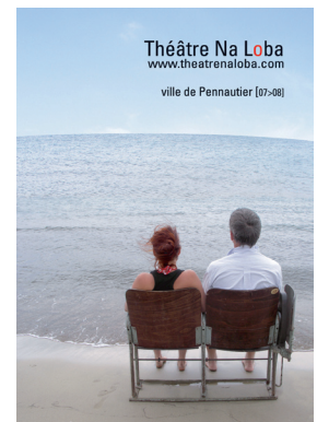
Théâtre Na Loba www.theatrenaloba.com ville de Pennautier (07-08)

Renseignements : 04 68 71 44 04 - contact@www.theatrenaloba.com - www.theatrenaloba.com